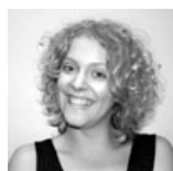
Carina R. Jacobsen: Gabriel, Dina, Elev, Metatrons Dame, Fuglenørd, Rytter